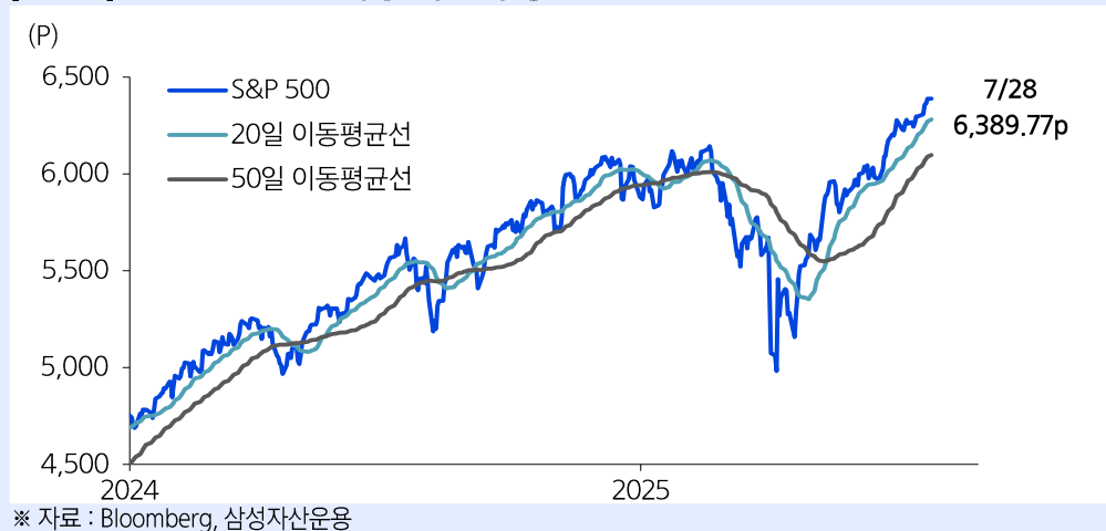
[그림 1] S&P 500 연일 사상 최고치 경신